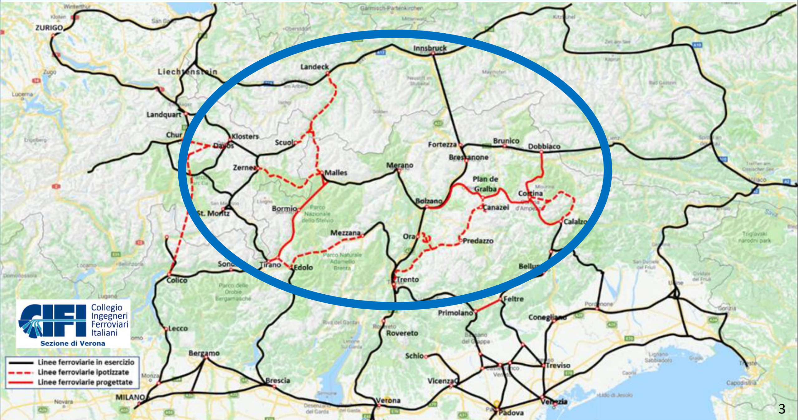
Mappa delle ferrovie in esercizio (nere), ipotizzate (tratteggiate in rosso) e progettate (rosse)