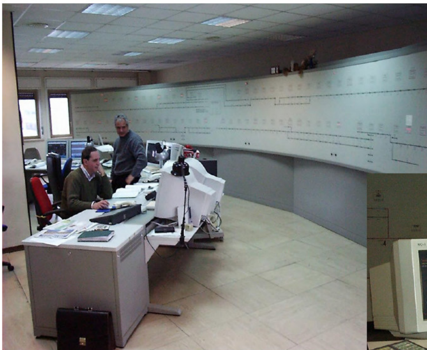
Postazione Operatore di Posto Centrale