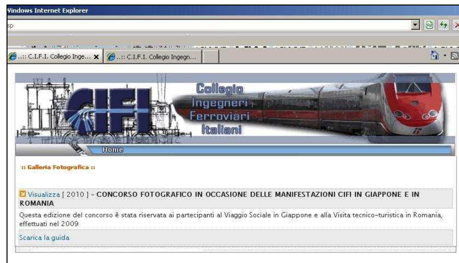
Figura 2. Pagina principale della galleria fotografica, recante l'elenco delle cartelle disponibili nella galleria fotografica.

ll'accesso, è visualizzato l'elenco delle cartelle disponibili. Ad ogni cartella corrisponde un evento organizzato dal CIFI.