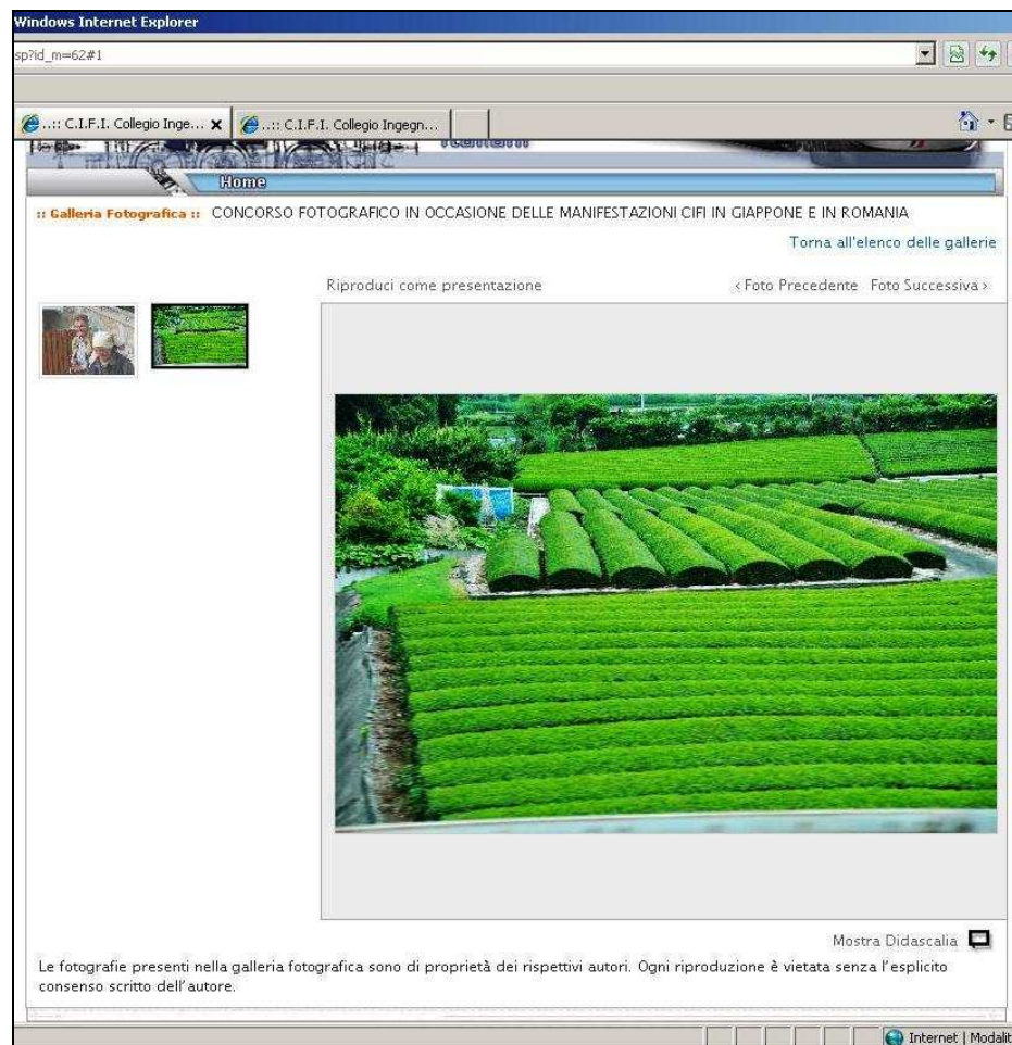
Figura 3. Visualizzazione di una cartella della galleria fotografica.

L'aspetto delle cartelle associate agli eventi è raffigurato in Figura 3.